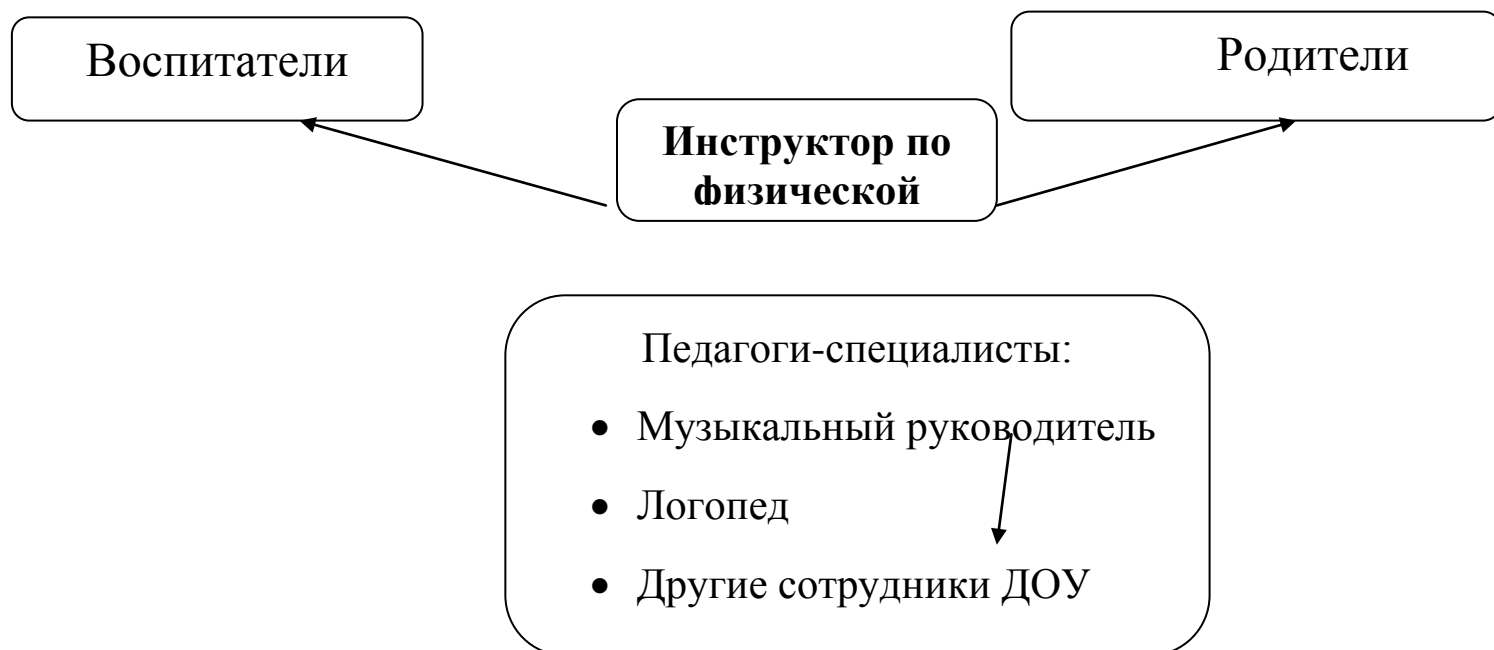
Схема организации работы по взаимодействию с другими участниками образовательного процесса